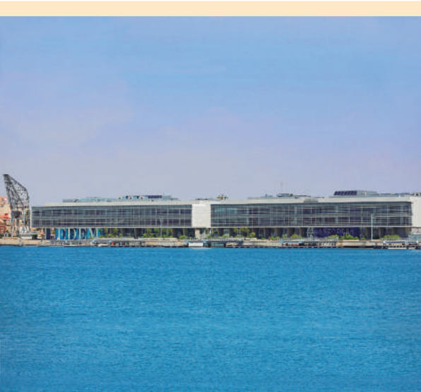
Instalaciones de Marina de Empresas.