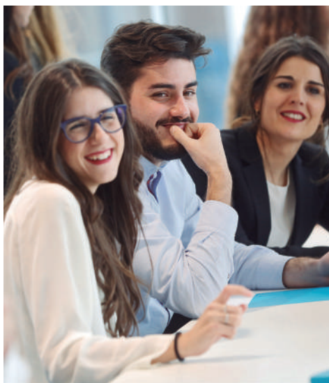
Grupo de alumnos en la cafetería de EDEM.

Los alumnos realizan un Trabajo Fin de Máster, adicional a las prácticas, mediante el que se persigue que el alumno pueda responder rigurosamente a un problema real dentro de la empresa. Supone el desarrollo y defensa de un trabajo fin de máster (150 horas). En definitiva, el objetivo de este particular examen es que aprendan a gestionar y resolver las situaciones habituales en el mundo empresarial.