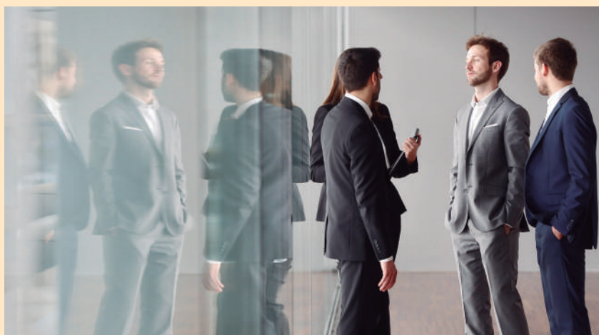
Alumnos de la 11ª edición del MBA Junior EDEM intercambiando ideas.

MBA 100% becado por la empresa becante y por EDEM, sin que los alumnos realicen desembolso económico. El coste para ellos será el esfuerzo y la dedicación (tiempo completo) así como el compromiso de inserción laboral en su empresa becante si se produce la oportunidad de incorporación.