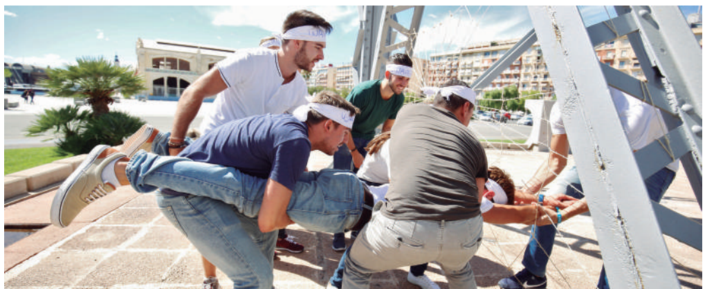
Grupo de alumnos durante una actividad outdoor.