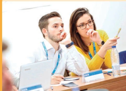
Alumnos durante una clase en las aulas de EDEM.