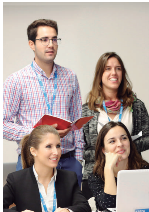
Alumnos durante una clase en las aulas de EDEM.