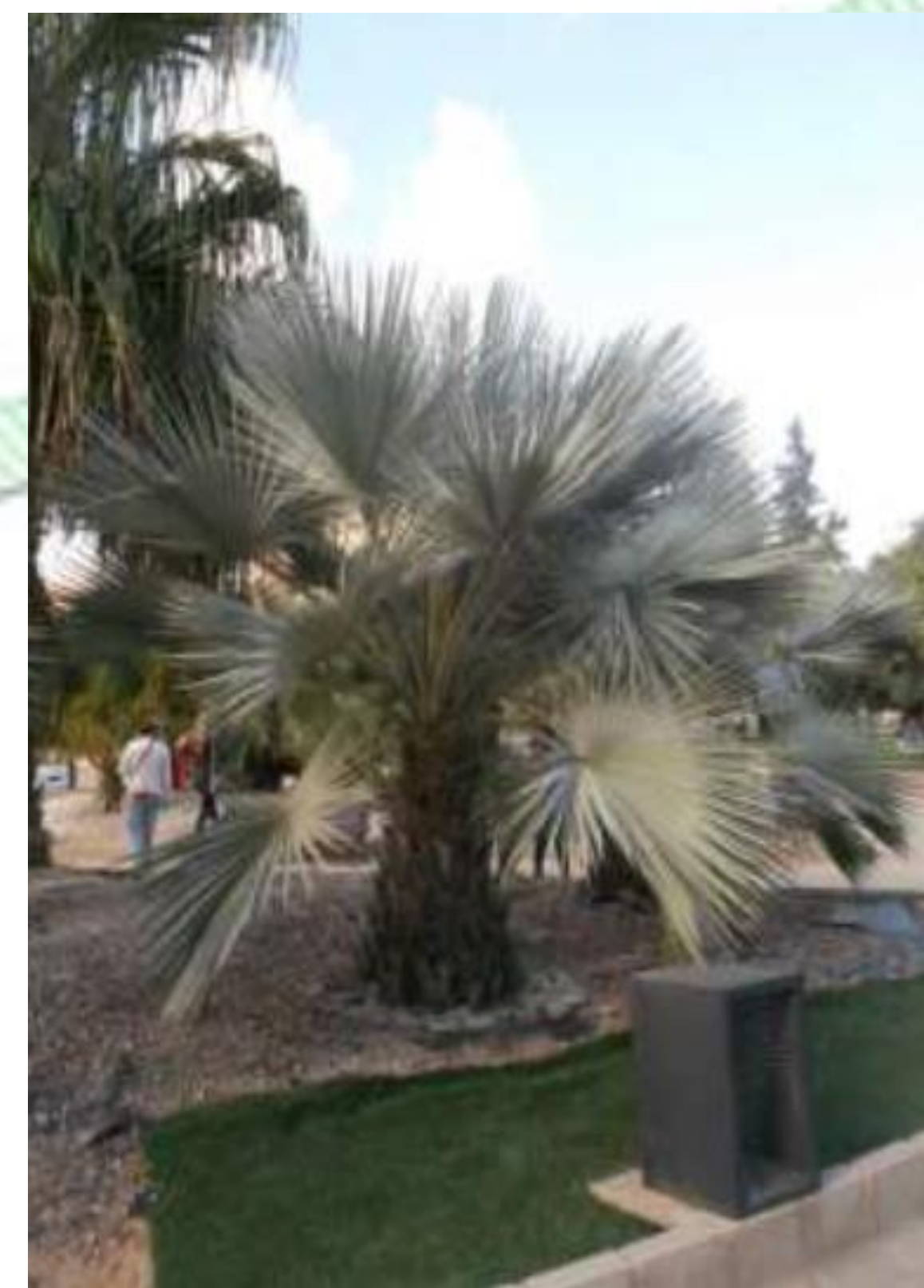
Brahea armata. Palmera Azul, Palmera robusta con hojas azuladas, inflorescencia en espadice, flores hermafroditas y frutos en drupa. Crecimiento lento, tolera la sequía, sensible a los encharcamientos.