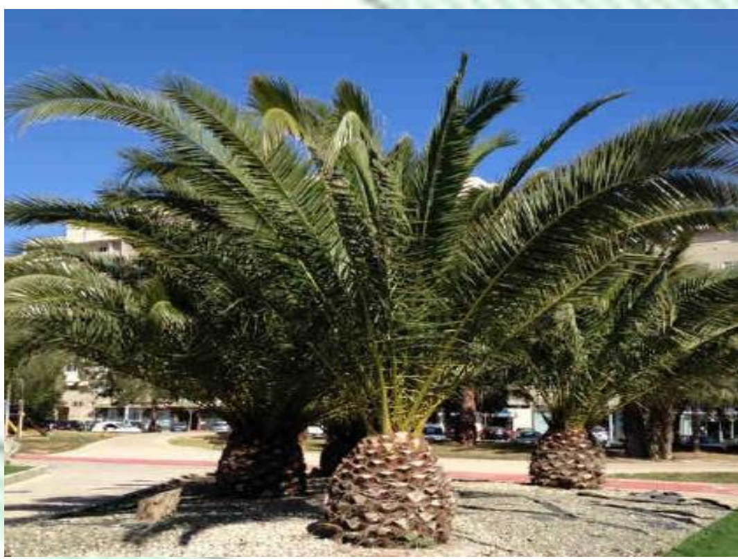
Phoenix canariensis. Palmera canaria. Copa de 10 m de diámetro, puede alcanzar los 20m.