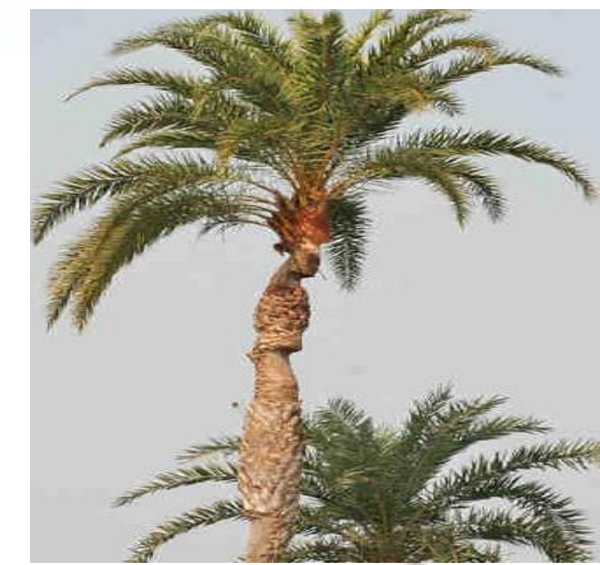
Phoenix sylvestris. Datilera plateada. Inflorescencias de hasta 1 m.