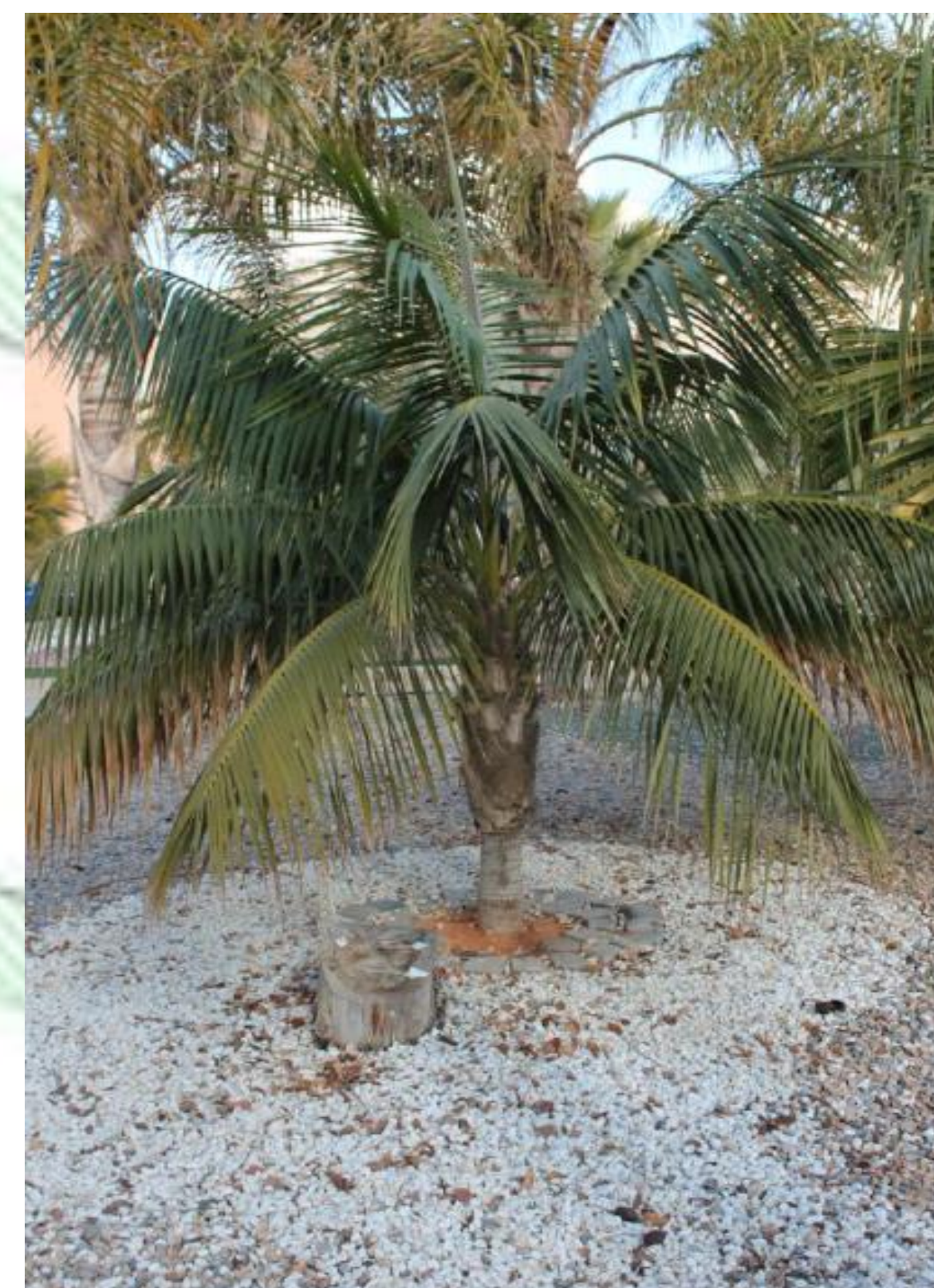
Howea fosteriana. Palma del paraíso.Palmera con hojas pinnadas, inflorescencia ramificada, flores blancas y frutos de forma ovoide. Tronco que puede llegar a superar los 18 m de altura por 15 cm de diámetro.