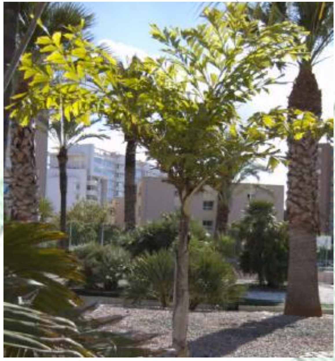
Caryota urens. Palma de cola de pescado. Palmera de crecimiento rápido de hasta 20 m. Hojas bipinnadas. Inflorescencias que desarrollan primero 2 flores masculinas y luego 1 femenina.