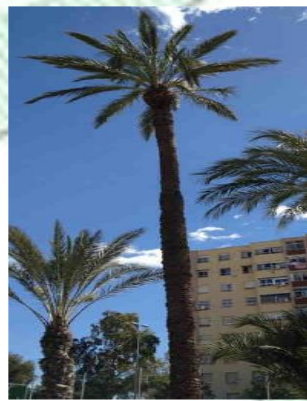
Phoenix dactilifera. Palmera datilera. Ejemplares femeninos(dátiles) y masculinos.