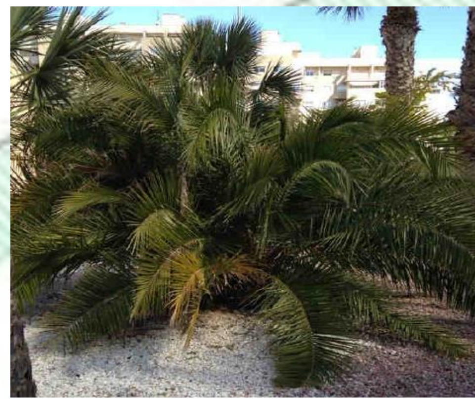
Phoenix rupicola. Palma de las rocas. Alcanza los 8 m y 30 cm de diámetro.