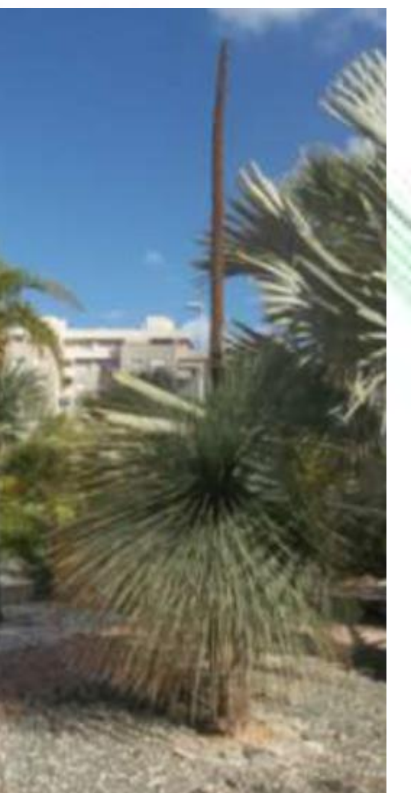
Daysilirion serratifolium. (Agavaceas). Alcanza un tamaño de hasta 2 m, hojas serradas de color verdosas, inflorescencia paniculada ,flores numerosas de color crema y frutos en cápsulas. Utilizada durante siglos para licor, medicinas...