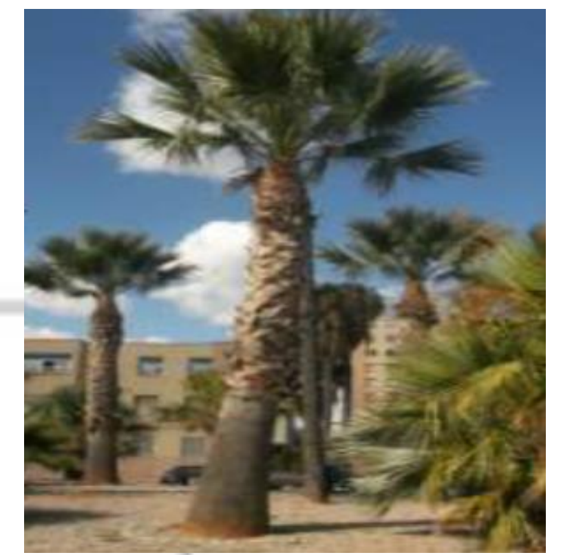
Washingtonia filifera. Palmera gruesa unicaule y sin capitel,columnar y altura de 8-12 m .