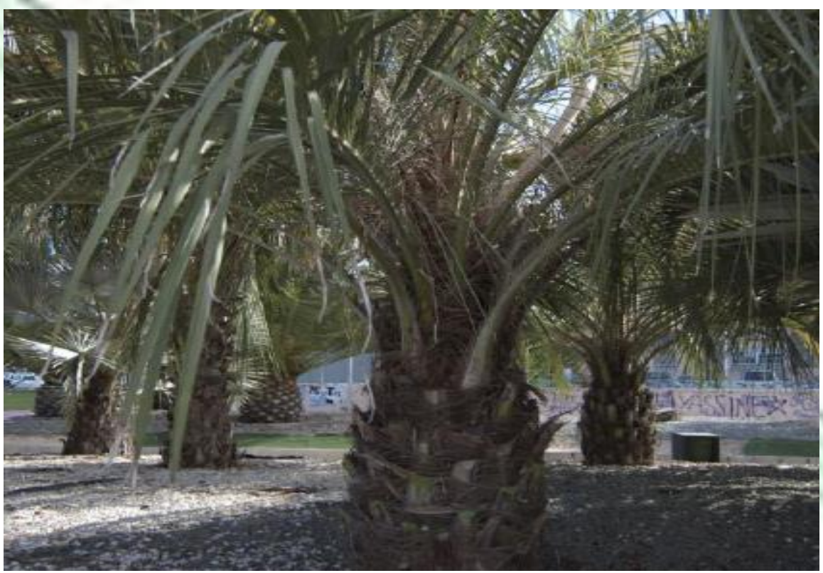
Butia yatay. Palma yatay. Flores amarillas de hasta 2 m de longitud.