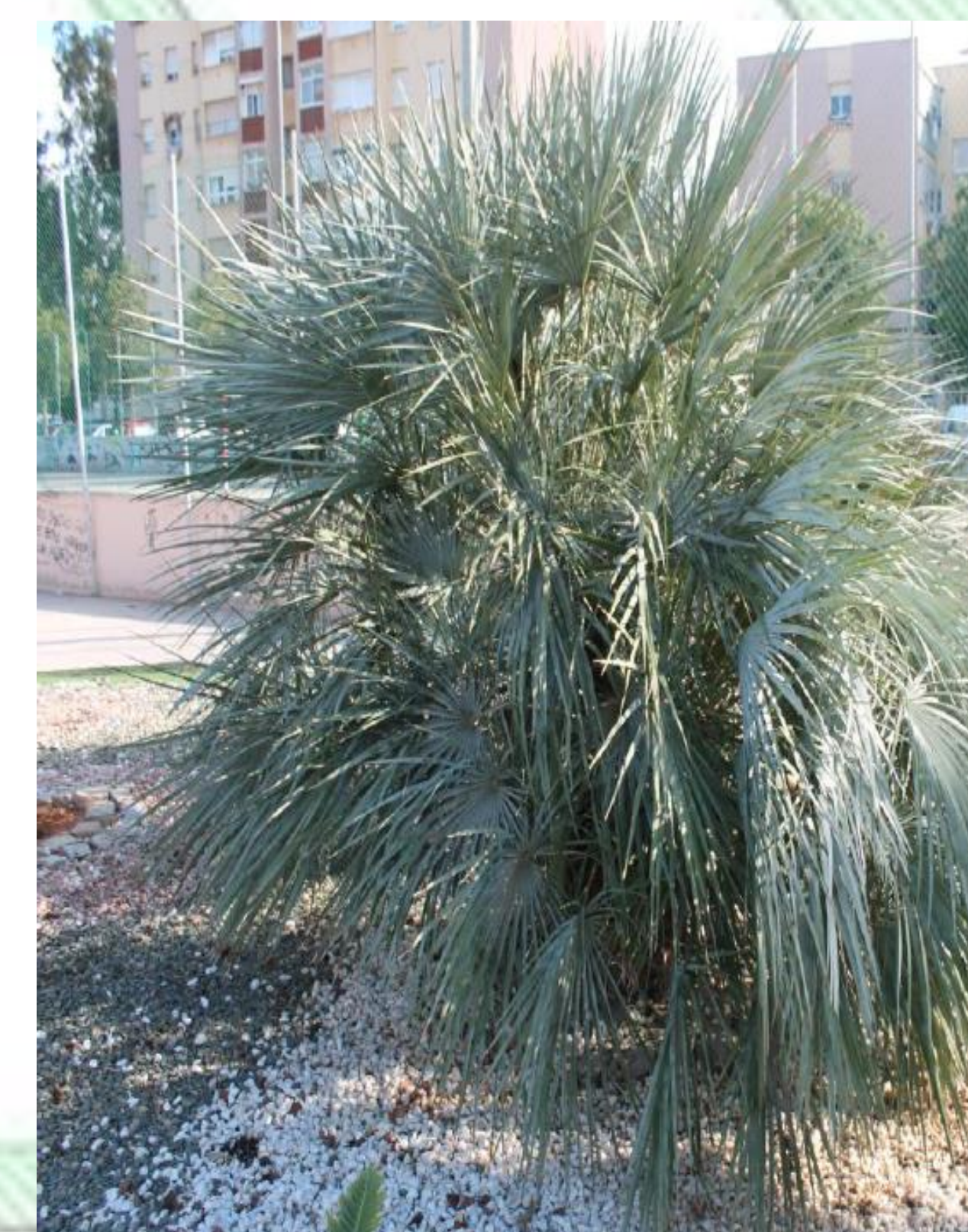
Nannorrhops ritchiana. Palmera Mazari. Palmera de porte subarborescente, hojas palmeadas, flores hermafroditas. Muy rústica, con troncos subterráneos y/o postrados.