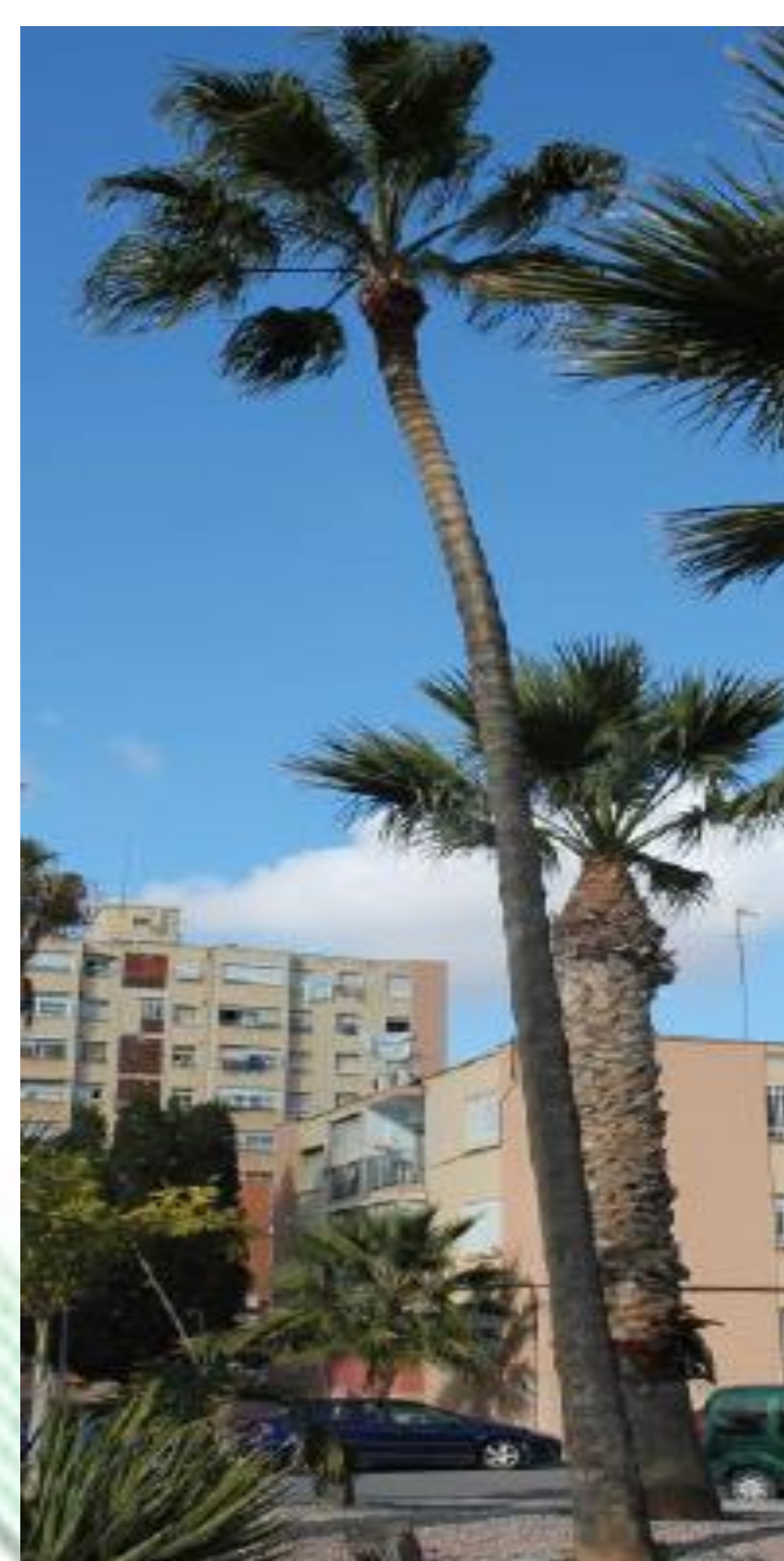
Washingtonia robusta. Palma Mexicana. Palmera de tronco robusto con hojas costapalmadas, flores de color crema, fruto ovoide. Es rústica.