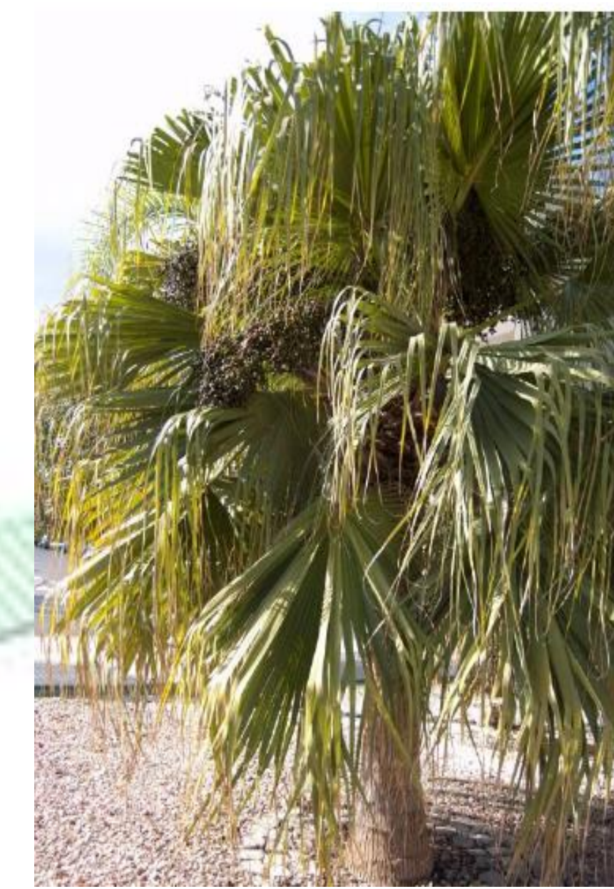
Brahea edulis. Palmera de Guadalupe. Alcanza 4.5-13 m de altura y 4 m de anchura. Hojas costapalmadas. Flores bisexuales en racimos.