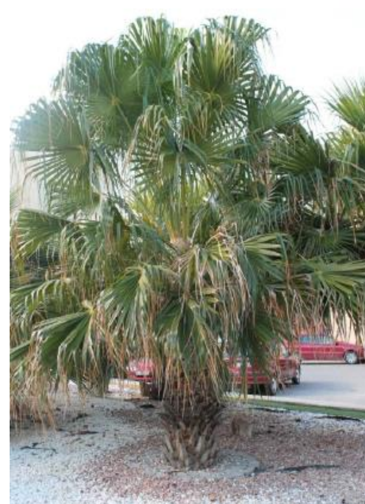
Livistona decipiens. Palmera llorona. Hojas palmeadas dividida en numerosos segmentos estrechos, largos y colgantes, con peciolos dentados.